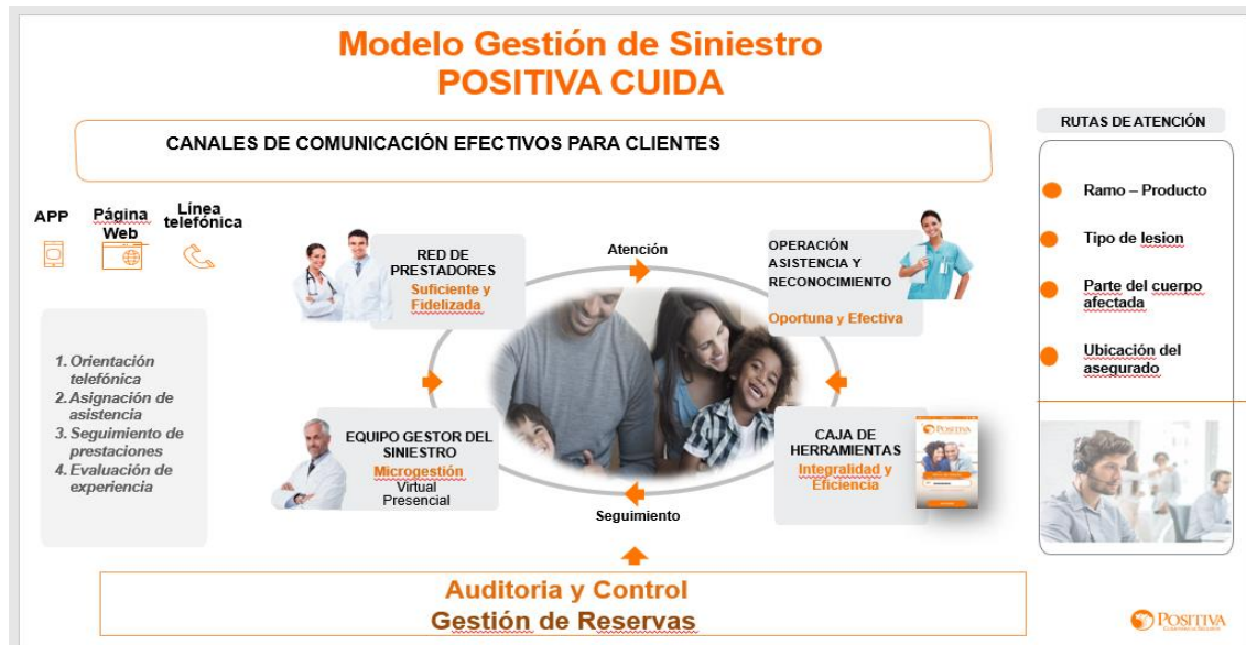
Figura 1. Modelo de Atención Positiva Cuida 2021

El Modelo POSITIVA CUIDA consta de cuatro (4) componentes: